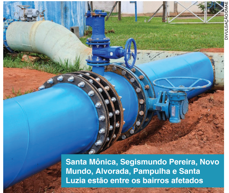
Santa Mônica, Segismundo Pereira, Novo Mundo, Alvorada, Pampulha e Santa Luzia estão entre os bairros afetados