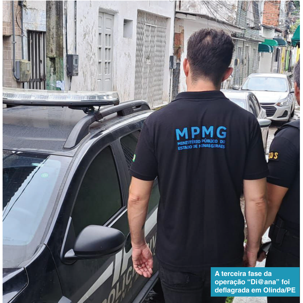
A terceira fase da operação “Di@ana” foi deflagrada em Olinda/PE

A partir de diligências cibernéticas avançadas, foi identificado parte dos usuários integrantes do “chan” ligados às condutas investigadas e o principal líder do grupo criminoso, usuário dos