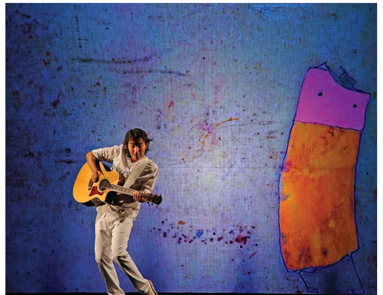
Projeto tem como objetivo apresentar a música como ponte para a poesia de Manoel Barros e Mário Quintana

O sucesso do "Crianceiras" vai além das escolas, sendo apresentado em importantes festivais e congressos nacionais e internacionais. Com mais de 500 apresentações para escolas públicas, privadas e eventos de entretenimento, o projeto já alcançou mais de meio milhão de crianças em todo o Brasil. Sua flexibilidade permite que seja apresentado em diferentes formatos, adequando-se à necessidade do